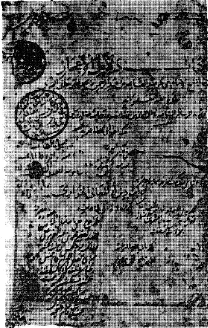
الصفحة الأولى من نسخة حسين جليبي ا معاني ( دلائل الإعجاز )